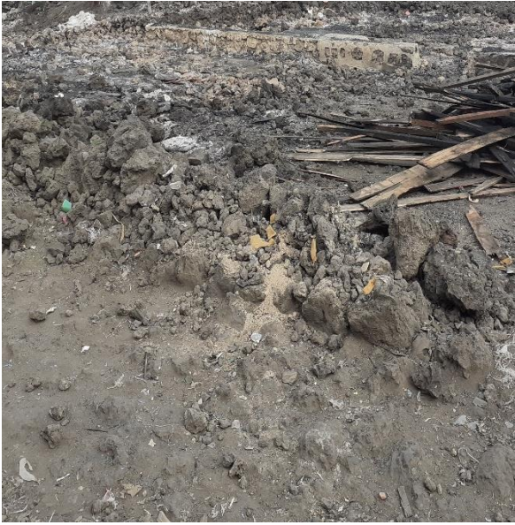
Bénéficiaire dont l'AGR était consommée par le volcan